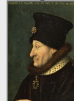
Philippe le Hardi Duc 1363–1404