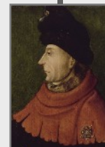
Jean sans Peur Duc 1404–1419