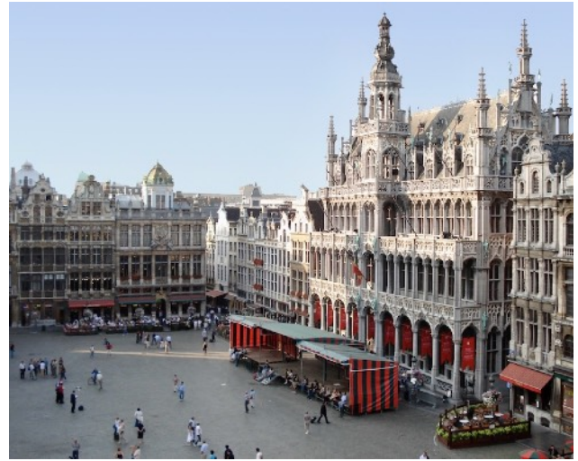
Die Grande Place von Brüssel

08:00–10:00 Bus: Brügge – Brüssel 10:00–12:15 Musée des Beaux-Arts; Gemälde von Rogier, Petrus Christus und Bruegel; zu Fuss zur Grande-Place (900 m) 12:15–13:45 freie Zeit 13:45–14:30 Rathaus 15:00–17:00 Bus-Transfer, Besuch Musée Art & Histoire 17:00–17:45 Bus: Brüssel – Löwen 19:00 gemeinsames Abendessen