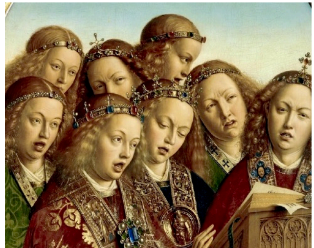
Brüder van Eyck, singende Engel des Genter Altars