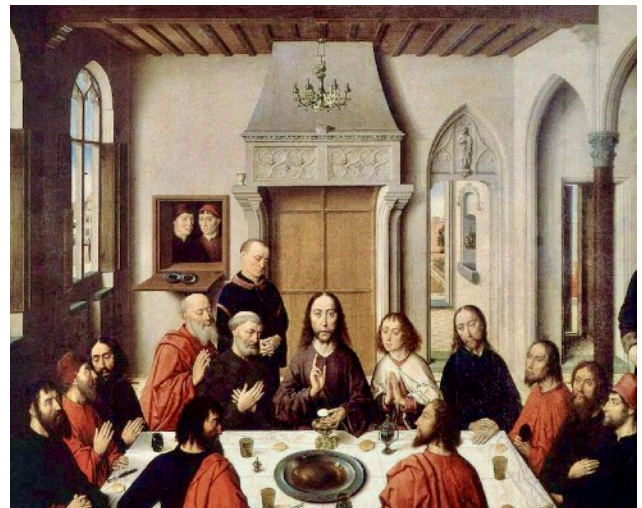
Dirk Bouts Abendmahlaltars in Löwen

08:00–12:00 Stadtrundgang mit Besuch des prachtvollen spätgotischen Rathauses. Besichtigung von des Abendmahlaltars von Dirk Bouts 12:00–15:00 freie Zeit 15:00–16:30 Museum Leuven individuelles Abendessen