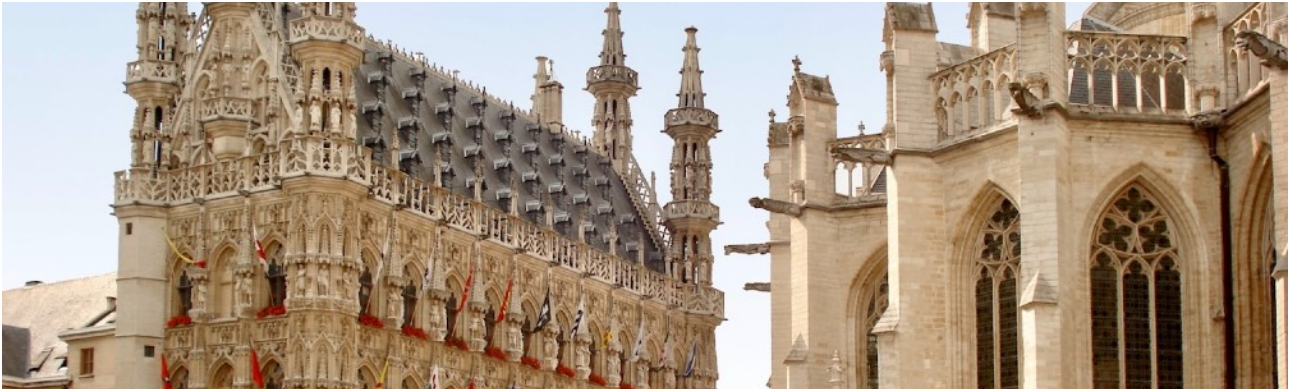
Löwen: Rathaus und Peterskirche