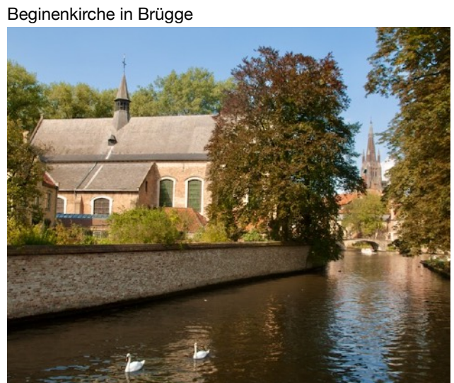
Beginenkirche in Brügge