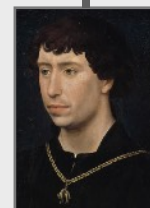
Karl der Kühne Duc 1467–1477