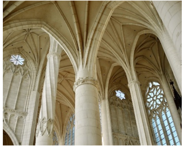
St-Nicolas-de-Port – Votivkirche der Schlacht bei Nancy