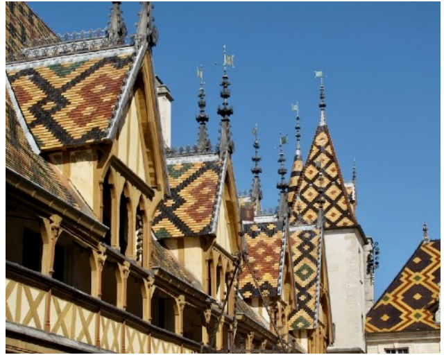
Quedlinburg – Stiftskirche St. Servatius