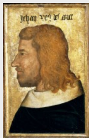
Jean II. le Bon Roi de France 1319–1364