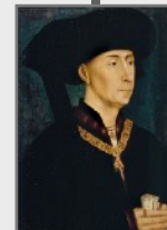
Philippe le Bon Duc 1419–1467