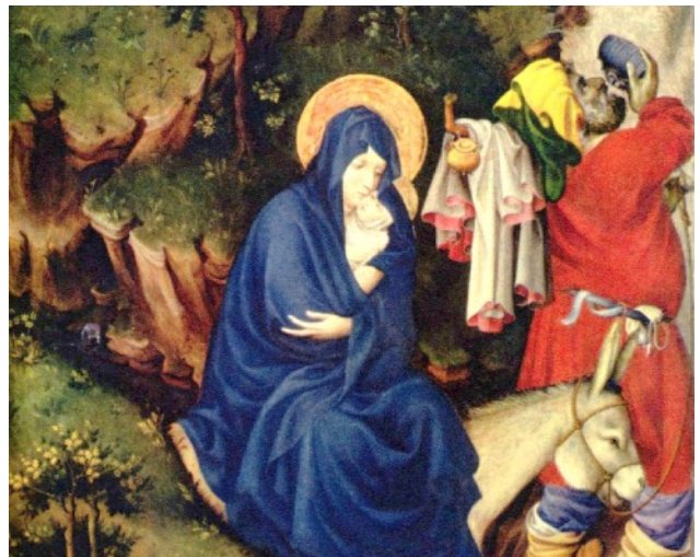
Melchior Broederlam, Frühwerk der burgundisch-niederländischen Malerei, Dijon, Musée des Beaux Arts

Reims, Kathedrale: der hochgotischer Engel lächelt