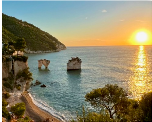
Die Faraglioni (Brandungsfelsen) an der Gargano-Küste