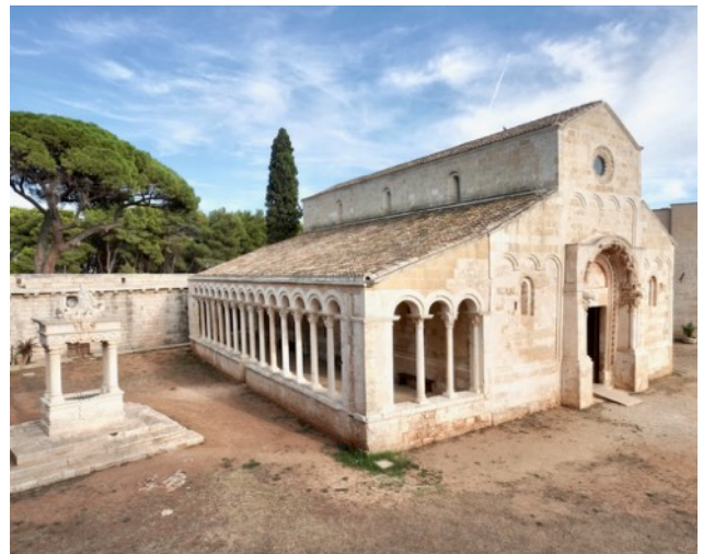
In der Abtei Cerrate sind u.a. historische Ölmühlen erhalten

10:00–10:45 Bus: Chiusa di Chietri – Egnazia (25 km) 10:45–12:00 Besuch der ergrabenen antiken Hafenstadt Gnathia 12:00–15:30 Bus: Egnazia – Abbazia di Cerrate (85 km) Verpflegung unterwegs 15:30–17:00 Besuch der romanischen Abtei Cerrate 17:00–18:00 Bus: Abbazia di Cerrate – Gallipoli 19:15 gemeinsames Abendessen