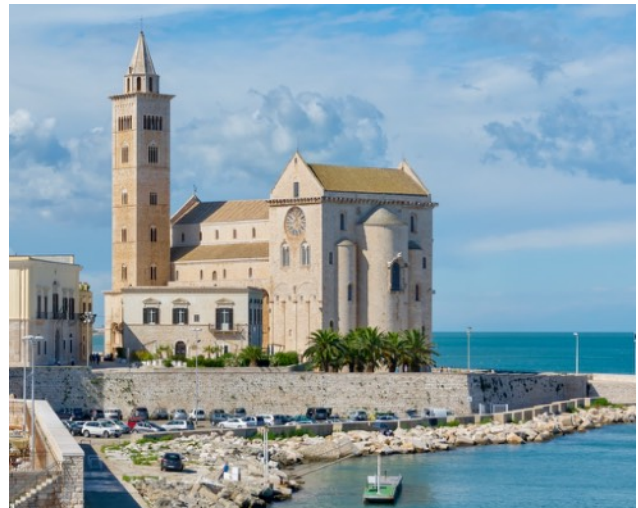
Trani, romanische Kathedrale am Meer 1097/1186