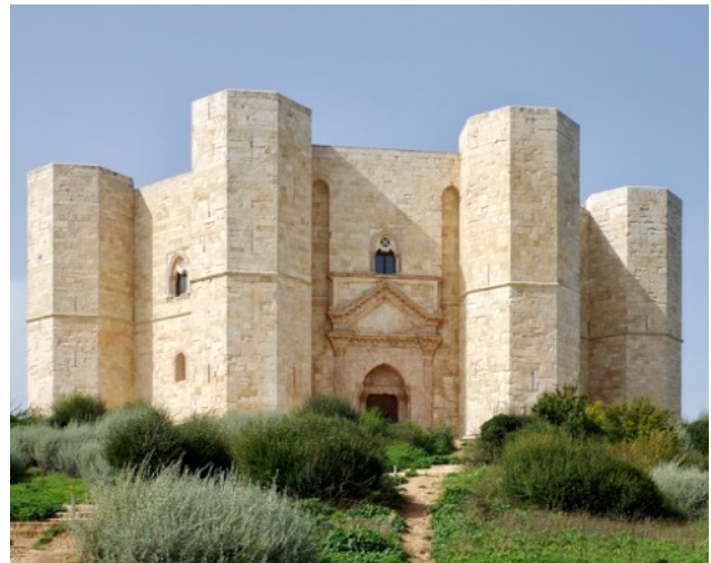
Castel del Monte, um 1250, die «Krone Apuliens»