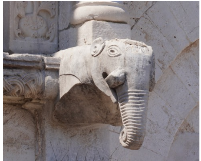
Elefanten-Konsole an der Kathedrale von Bari

10:00–11:00 Bus: Chiusa di Chietri – Bari (53 km) 11:00–12:00 Bari: Castello 12:00–14:00 freie Zeit 14:00–15:00 San Nicola 15:00–15:30 Kaffeepause 15:30–16:30 Kathedrale 16:30–18:00 Bus: Bari – Chiusa di Chietri 19:00 gemeinsames Abendessen