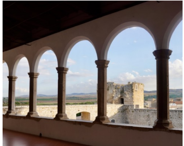
Venosa, Blick aus der Loggia über das Kastell

ca 07:33–15:56 Zürich – Napoli Afragola 16:00–19:00 Bus: Afragola – Venosa mit kulturellem Zwischenhalt 19:15 Hotel Orazio , Zimmerbezug 20:00 gemeinsames Abendessen