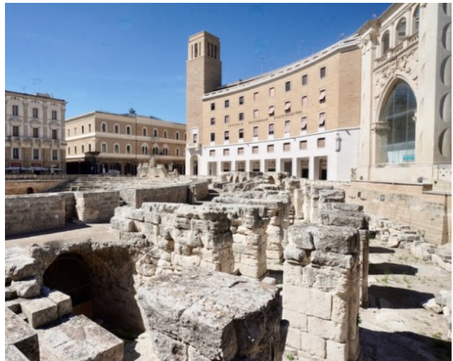
Römisches Amphitheater in Lecce

07:00–07:45 Bus: Gallipoli – Lecce 08:06–16:54 Frecciarossa: Lecce – Milano 16:54–18:10 freie Zeit (Verspätungs-Reserve / Aperó) 18:10–21:27 SBB: Milano – Zürich