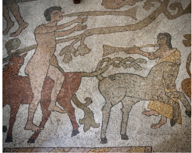
Der Dom von Otranto ist berühmt für sein Bodenmosaik

09:00–10:00 Bus: Gallipoli – Otranto (55 km) 10:00–10:30 Kaffeepause am Strand 10:30–12:00 Besuch der Kathedrale Santa Annunziata 12:00–13:00 Besuch San Pietro 13:00–16:00 freie Zeit 16:00–16:30 Bus: Otranto – Punto Palascia 16:30–17:30 Spaziergang zum Leuchtturm (feste Schuhe) 17:30–19:00 Bus: Punto Palascia – Gallipoli (60 km) 19:15 gemeinsames Abendessen