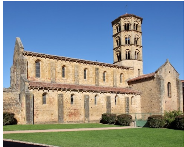
Anzy-le-Duc – bekannt für Architektur und Skulptur

09:00 – 10:00 Bus: Cluny – Paray-le-Monial (55 km) 10:00 – 11:45 Paray-le-Monial «Cluny III im Taschenformat» 11:45 – 12:30 Bus: Paray-le-Monial – Briant (20 km) 12:30 – 14:30 gemeinsames Mittagessen Auberge de Briant 14:30 – 15:00 Bus: Briant – Anzy-le-Duc 15:00 – 16:30 Anzy-le-Duc (1090 – 1130), Kapitellplastik 16:30 – 17:00 Bus: Anzy-le-Duc – Neuilly-en-Donjon (20 km) 17:00 – 17:45 Neuilly-en-Donjon interessantes Tympanon 17:45 – 19:15 Bus: Neuilly-en-Donjon – Cluny (80 km) individuell Abendessen