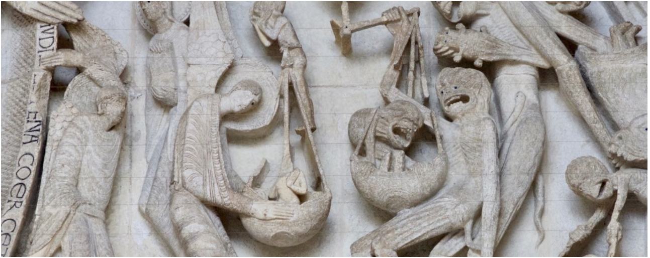
Seelenwägung im Weltgericht des Bildhauers Gislebertus um 1130/1140 Westportal der Kathedrale von Autun