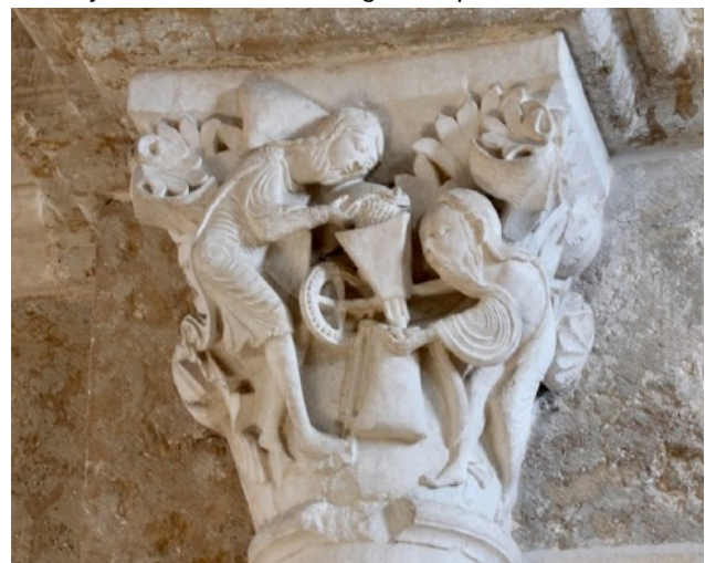
Vézelay - reicher Schatz an Figurenkapitellen

09:00 – 12:00 Vézelay, Ste-Madeleine (1120–1140; Umgangschor frühgotisch) reiche Skulptur 12:00–14:30 freie Zeit 14:30–15:45 Bus: Vézelay – Saulieu (60 km) 15:45–17:00 Saulieu 17:00–18:30 Bus: Saulieu – Vézelay (60 km) 19:30 gemeinsames Abendessen L'Éternel