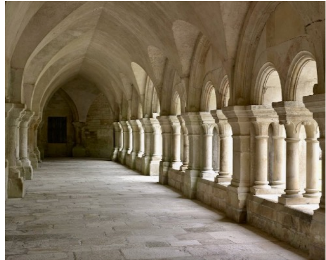
Fontenay – Kreuzgang des frühen Zisterzienserklosters