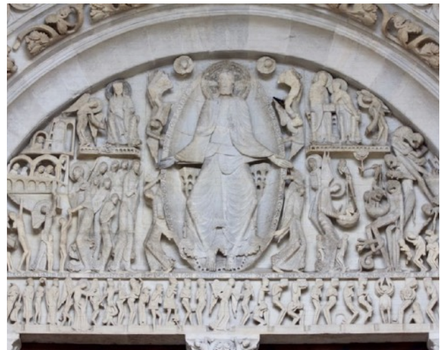
Autun – Weltgericht des Gislebertus

09:00–10:45 Bus: Cluny – Autun (80 km) 10:45–11:00 Porte St-André römisches Stadttor 11:00–11:15 Bus & zu Fuss zur Kathedrale 11:15–13:00 Autun, Kathedrale Kirche und Salle Capitulaire mit Kapitellen 13:00–15:00 freie Zeit 15:00–16:30 Autun, Musée Rolin liegende Eva 16:30–18:00 Bus: Autun – Vézelay (100 km) individuell Abendessen