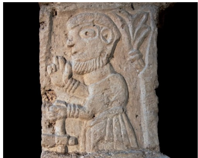
Tournus – früheste Romanik: Künstlerbildnis des Gerlanus