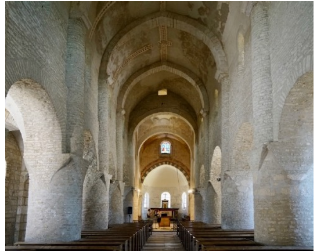
Chapaize, – wuchtige Pfeiler und Spitztonnengewölbe